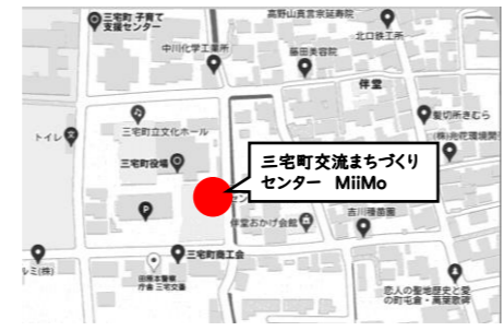
(奈良県磯城郡三宅町伴堂689番地) 近鉄橿原線石見駅下車西へ(徒歩約18分) 近鉄田原本線黒田駅下車北へ(徒歩約15分)