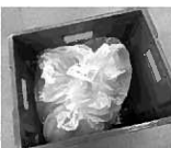
折り畳みコンテナ (緑のオリコン)